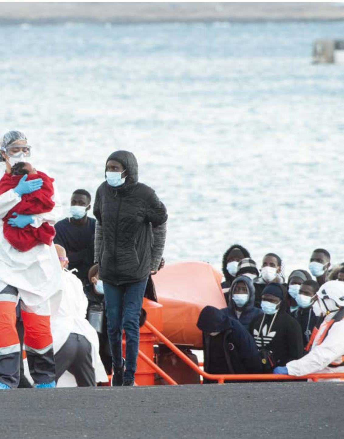
DESEMBARCO EN EL PUERTO DEL ROSARIO, FUERTEVENTURA, TRAS EL RESCATE DE SALVAMENTO MARÍTIMO DE 50 PERSONAS MIGRANTES SUBSAHARIANAS, ENTRE LOS QUE SE ENCONTRABAN TRES BEBÉS Y OCHO MUJERES EN UNA EMBARCACIÓN NEUMÁTICA A LA DERIVA, A UNOS 53 KILÓMETROS AL SUR DE LA ISLA. JUNIO 2021.