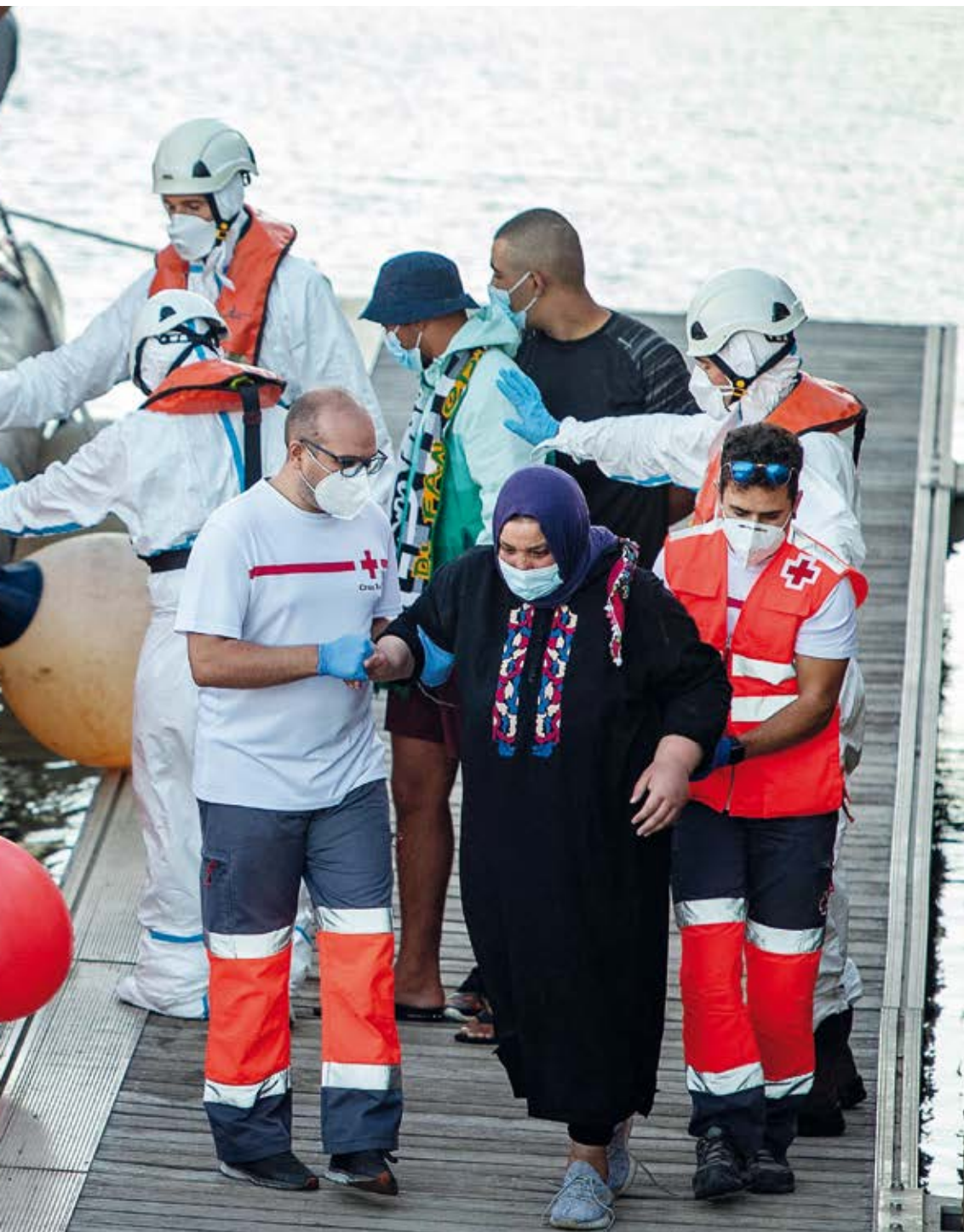
DESEMBARCO TRAS EL RESCATE DE SALVAMENTO MARÍTIMO DE UN TOTAL DE 52 PERSONAS MIGRANTES (42 HOMBRES Y TRES MUJERES) QUE VIAJABAN EN DOS PATERAS RUMBO A PUERTO AMÉRICA, EN LA CAPITAL GADITANA, CÁDIZ (ESPAÑA), SEPTIEMBRE DE 2021.