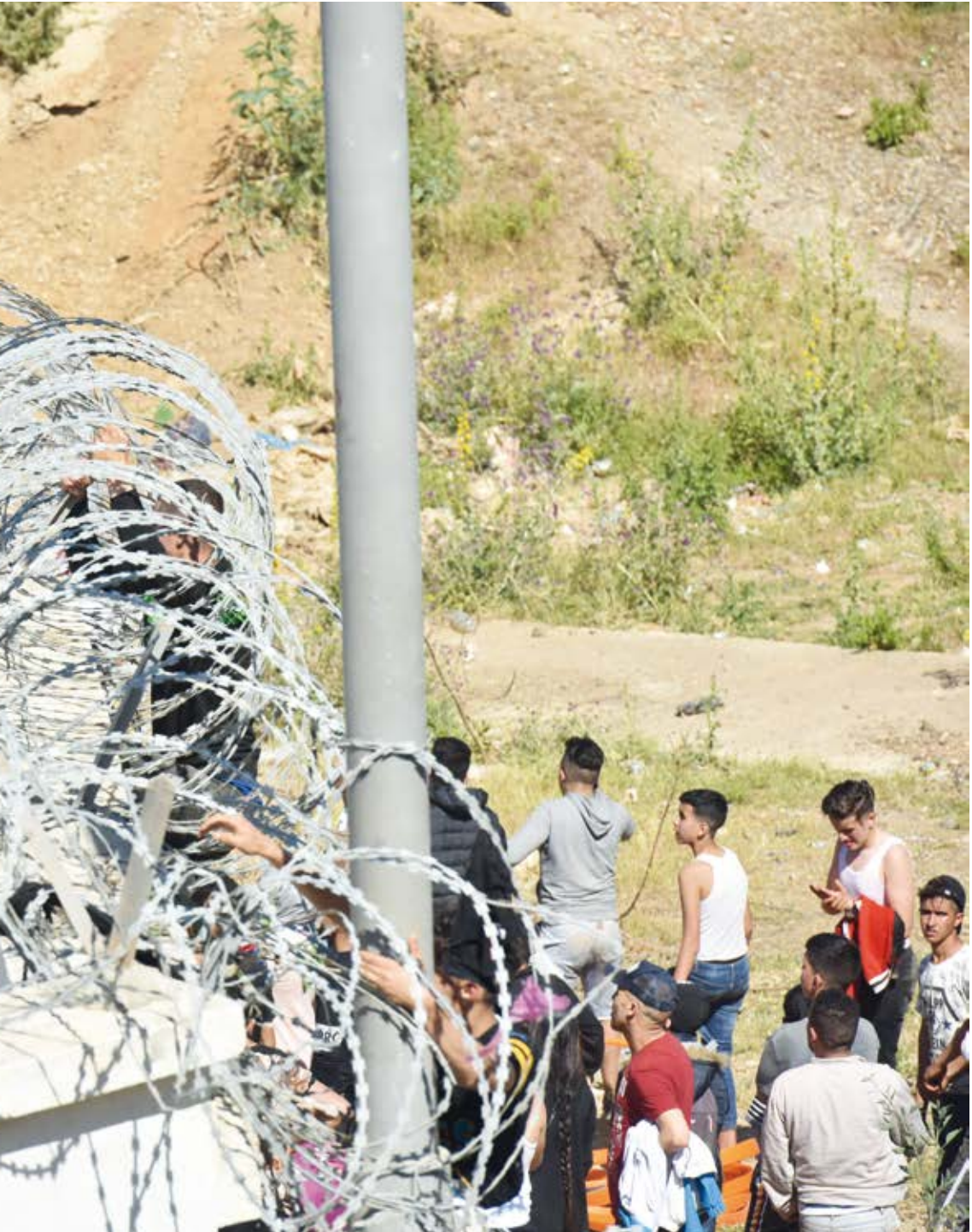
JÓVENES MIGRANTES SUBEN LA VALLA EN LA CIUDAD NORTEÑA DE FNIDEQ EN UN INTENTO DE CRUZAR LA FRONTERA DESDE MARRUECOS HASTA EL ENCLAVE ESPAÑOL DE CEUTA, EL 18 DE MAYO DE 2021. EN POCO MÁS DE 24 HORAS, UN TOTAL DE CASI 8.000 PERSONAS ENTRARON EN LA CIUDAD ESPAÑOLA DE CEUTA, SITUADA EN LA COSTA NORTEAFRICANA. FRONTERA ENTRE FNIDEQ (MARRUECOS) Y CEUTA (ESPAÑA), MAYO DE 2021.