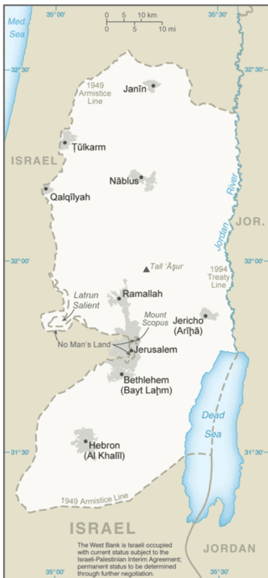
Mapa: CIA World Factbook, West Bank (Consulta: 7 de Marzo de 2014 12:00).