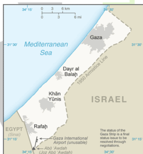
Mapa: CIA World Factbook, Gaza Strip (Consulta: 7 de Marzo de 2014 12:05).